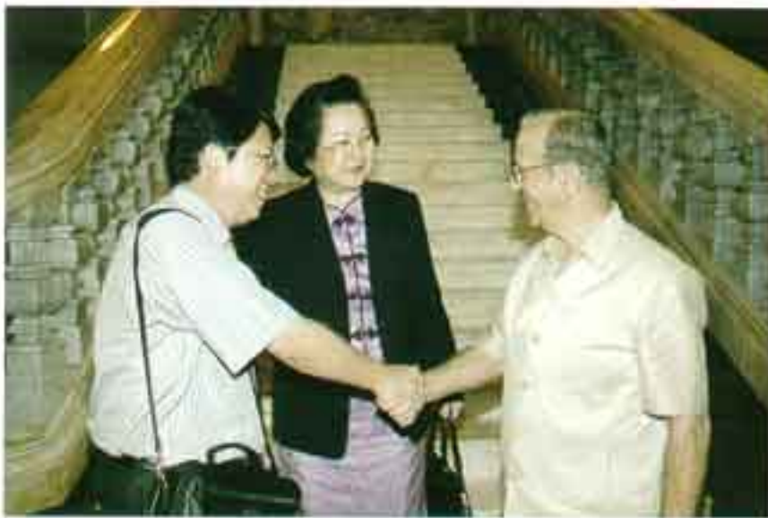
President, Fujian University, China เยี่ยมคารวะผู้บริหาร และเยี่ยมชมวิทยาเขตบางนา เมื่อวันที่ 11 พฤศจิกายน 2548