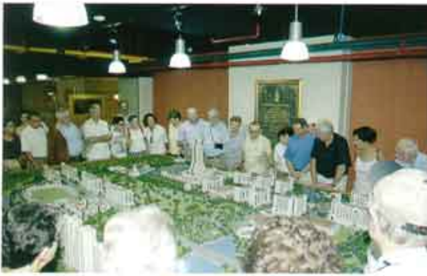
คณะครูประเทศเปรู 42 คน เยี่ยมคารวะผู้บริหาร และเยี่ยมชมวิทยาเขตบางนา เมื่อวันที่ 11 พฤศจิกายน 2548