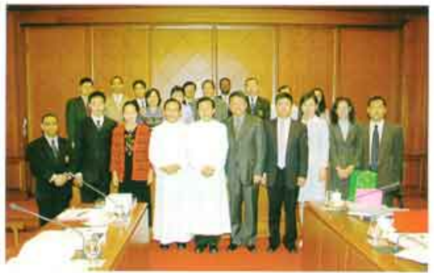
ผู้แทนกระทรวงศึกษาธิการ สาธารณรัฐประชาชนจีน จำนวน 5 คน เยี่ยมคารวะผู้บริหารและเยี่ยมชมวิทยาเขตบางนา เมื่อวันที่ 25 พฤศจิกายน 2548