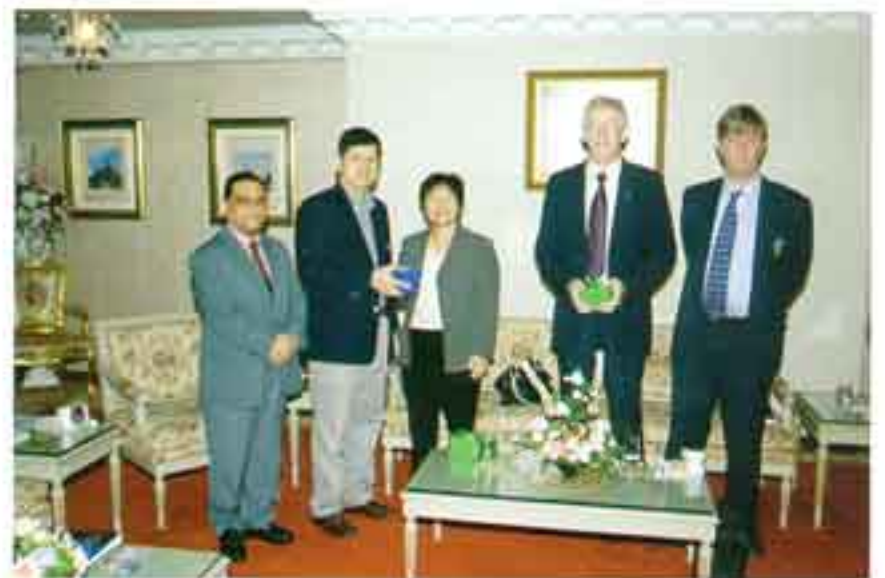
ผู้บริหาร SEAMEO-RELC จำนวน 2 คน เยี่ยมคารวะผู้บริหาร และเยี่ยมชมวิทยาเขตหัวหมาก เมื่อวันที่ 26 พฤศจิกายน 2548