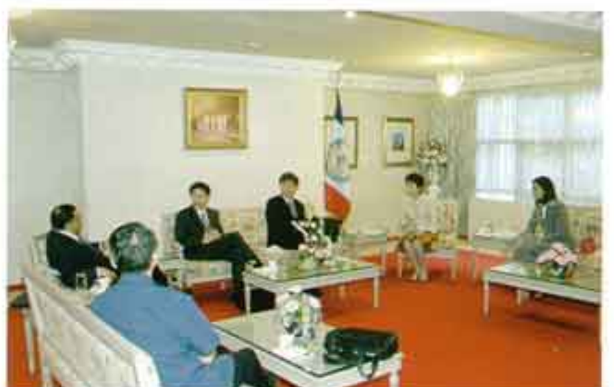
ผู้บริหาร Taiwan National Chengchi University, Taiwan จำนวน 2 คน เยี่ยมคารวะผู้บริหารและเยี่ยมชมวิทยาเขตหัวหมาก เมื่อวันที่ 28 พฤศจิกายน 2548