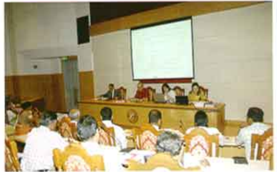
ผู้บริหาร Senior Sri Lankan University Officials, Sri Lankan จำนวน 16 คน เยี่ยมการและเยี่ยมชมวิทยาเขตบางนา เมื่อวันที่ 4 พฤศจิกายน 2548